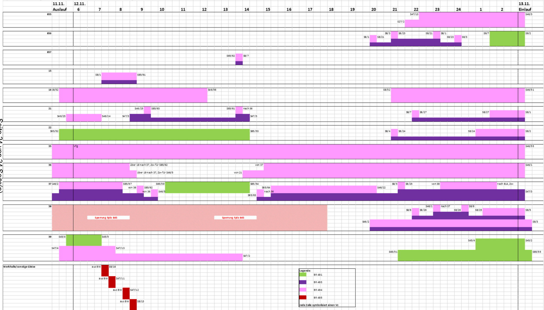
Fplo 485 - Rangier- und Abstellplan Grünau Sonntag 12.11.2023